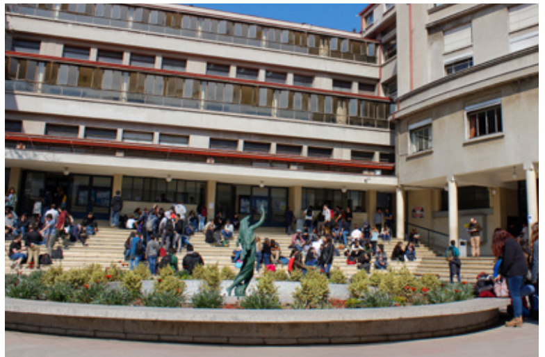
Patio interior – Facultad de Derecho