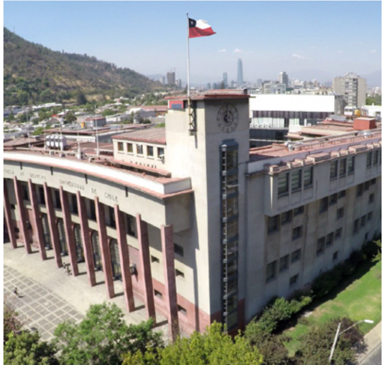
Fachada – Facultad de Derecho, Universidad de Chile