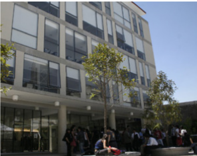
Edificio Los Presidentes – Facultad de Derecho